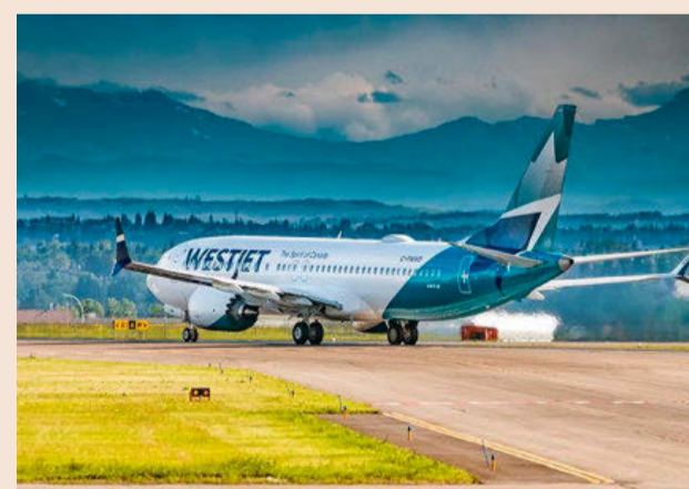
WestJet será la tercera aerolínea que enlace Barcelona y Canadá.

Norwegian, que fue la primera compañía en anunciar vuelos de largo recorrido y bajo coste desde Barcelona, prevé comenzar operaciones con Buenos Aires –monopolio ahora de Level– y Mendoza (Argentina), además de mantener sus rutas con Los